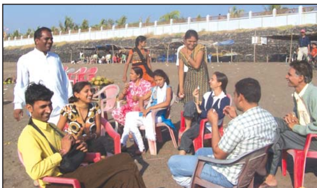
Our Team 2015 - 2016

Hariraj Charitable Trust has an efficient qualified and experienced team of 15 members in the field and office during the year 2015-16